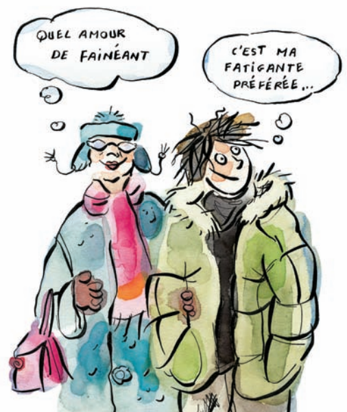
ILLUSTRATION : ANNE VILLENEUVE

SOULIÈRES ÉDITEUR www.soulieresediteur.com