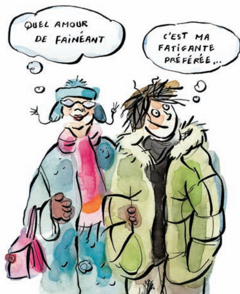
ILLUSTRATION : ANNE VILLENEUVE

SOULIÈRES ÉDITEUR www.soulieresediteur.com