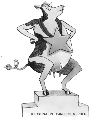
ILLUSTRATION : CAROLINE MEROLA