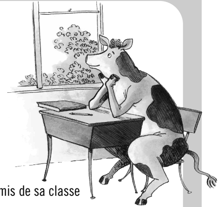
ILLUSTRATION : CAROLINE MEROLA