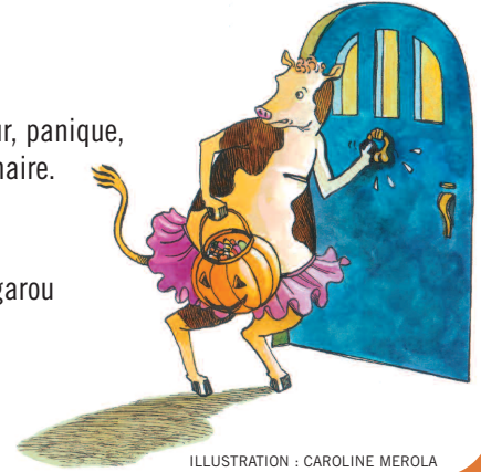
ILLUSTRATION : CAROLINE MEROLA

Moyenne de douze à quinze mots par phrase