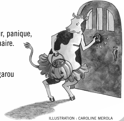
ILLUSTRATION : CAROLINE MEROLA

Moyenne de douze à quinze mots par phrase